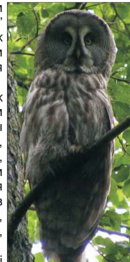
Барадатая кугакаўка.

Напэўна ў гэтым годзе летнік атрымаўся адным з самых удалых за апошнія 5 год. Удалося і птушак пабачыць-пачуць, і гнездавыя скрыні праверыць, і новыя развесіць, а таксама проста адпачыць у кампаніі старых і новых сябраў. Разам для птушак і людзей!