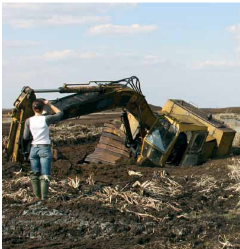
Единственный в своем роде памятник добыче торфа – утонувший экскаватор