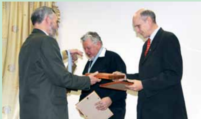
Каманда-пераможца леташняга чэмпіянату атрымлівае ўзнагароду на 3'ездзе АПБ.

Запрашаем прыняць удзел у VIII чэмпіянаце па спартыўнай арніталогіі. Ён традыцыйна адбудзецца ў першую суботу восені (3 верасня). Але на гэты раз удзельнікі будуць назіраць за птушкамі не 9 гадзін, як раней, а 12 (з 6.00 да 18.00).