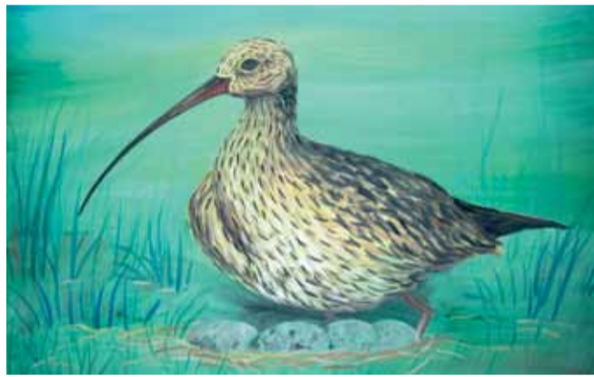
Дыплом першай ступені ў мастацкім конкурсе. Кузуро Вікторыя, 14 гадоў

23 красавіка Барысаўскім экалагічным цэнтрам дзяцей і юнацтва на базе ДУА «АСШ №7 г. Барысава» быў праведзены фэст «Дзень Зямлі – 2011». Актыўны ўдзел у падрыхтоўцы і правядзенні фэсту прыняла Барысаўскае раённае аддзяленне АПБ. На гэтым мерапрыемстве былі ўзнагароджаны прызёры конкурсаў, якія праводзіліся ў межах нацыянальнай кампаніі «Вялікі краншнэп – птушка 2011 года».