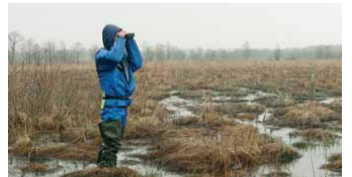
Удзельнік лагера на балоце Дзікае

Правядзенне на самым пачатку красавіка семінара-лагера з романтичнай назвай, якая крыху заварожвае, “Начныя жыхары ляСОЎ” ўжо сталася прыёмнай традыцыяй.