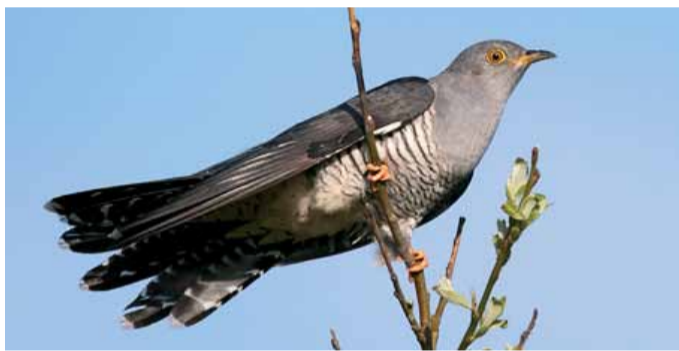
Кукушка обыкновенная.

Кембриджский секретариат BirdLife International реализует культурный проект под названием «Птицы и Люди». Британский писатель Марк Кокер и фотограф Дэвид Типлинг собирают информацию о том, как в культуре раз-