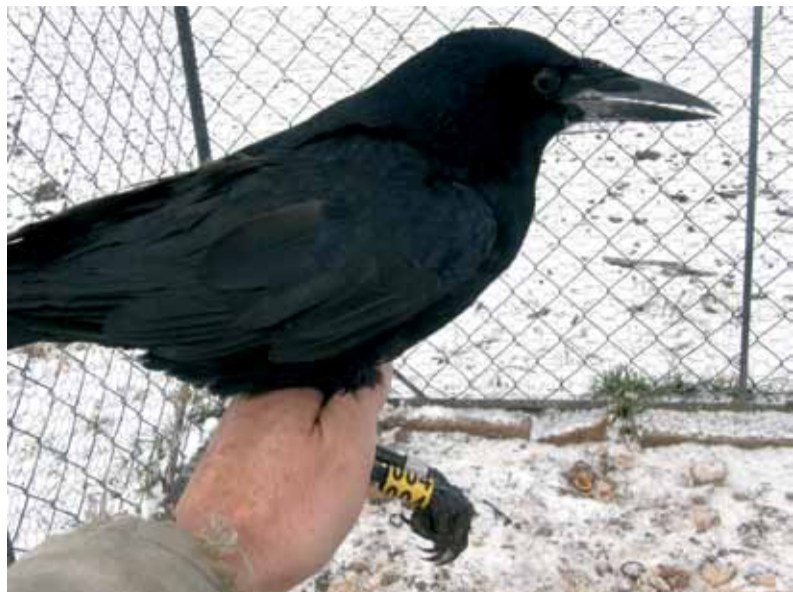
Акальцаваны грак.

На тэрыторыі горада Пардубіцэ (Усходняя Чэхія) на працягу доўгіх гадоў знаходзіцца адно з самых вялікіх у Чэхіі месцаў зімоўкі гракоў і кавак. Штогод тут зімуюць каля 40 тысяч гэтых птушак. Адным з метадаў даследавання міграцыі, працягласці жыцця птушак і іншых цікавых момантаў з'яўляецца іх акальцаванне.