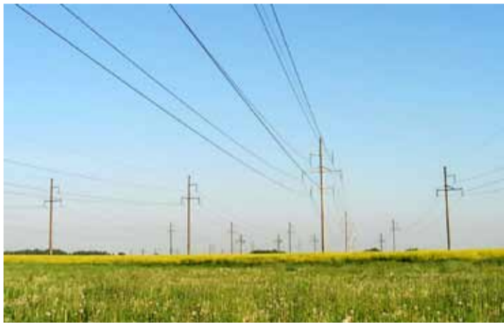
Линии электропередач на 110 кВ

Ирина Самусенко, научный сотрудник НПЦ НАН Беларуси по биоресурсам.