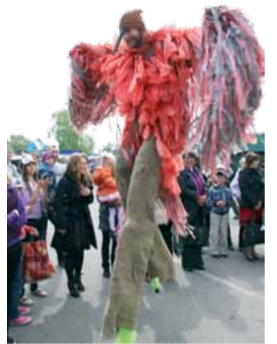
У натоўпе паважна шпацыраваў велізарны турухтан на хадулях, выклікаючы захапленне не толькі ў мясцовых дзяцей, але і ў стальных жыхароў

Фэст кулікоў традыцыйна адрознівае адукацыйны аспект. У гэтым годзе ўсе жадаючыя змаглі паўдзельнічаць у творчых майстар-класах. Пад