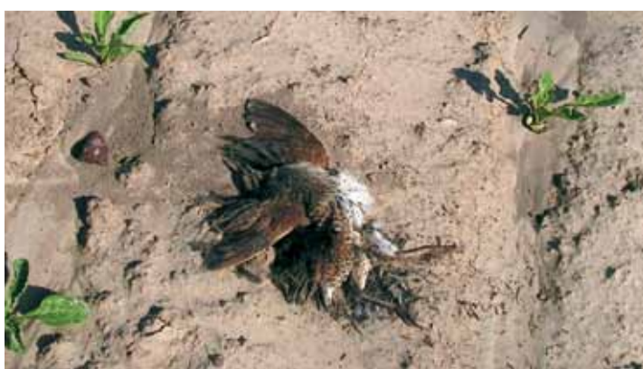
Коростель, погибший на ЛЭП