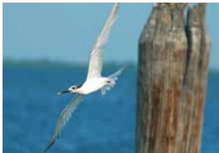
Пестроноса крачка

Новый для страны вид птиц – пестроноса крачка Sterna sandvicensis – отмечен в Беларуси. Пара птиц в брачном оперении наблюдалась 23 мая 2011 года на территории рыбхоза «Днепробугский» (Дрогичинский район, Брестская область) на песчаной отмели среди озерных чаек, белокрылых,