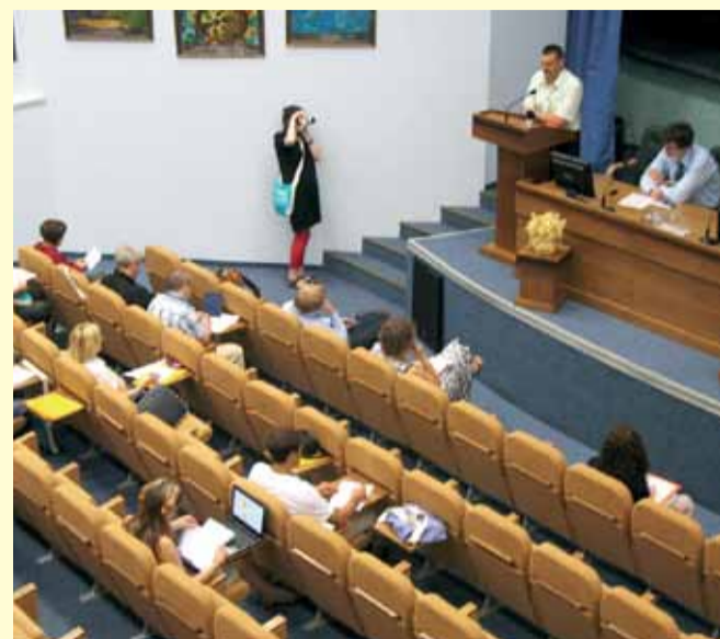
Пленарное заседание участников форума.

С 3 по 5 июня в Березинском биосферном заповеднике прошел Форум общественных экологических организаций Беларуси. В этом году участие в обсуждении актуальных вопросов экологии и охраны окружающей среды приняли более 120 представителей из Беларуси и стран зарубежья. Организаторами Форума являются ведущие белорусские экологические организации: «Зелёная сеть», «Ахова птушак Бацькаўшчыны», «Живое партнерство», «Центр экологических решений», «Экодом» и «Экопроект Партнерство».