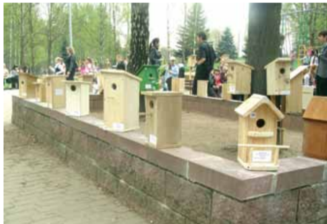
Выстава домікаў для птушак

У гэтым годзе Тыдзень Птушак у Мінску прайшоў як ніколі актыўна. Адным з самых цікавых мерапрыемстваў кампаніі стаў адкрыты экалагічны конкурс для ўстаноў адукацыі г. Мінска “Хатка для крылатага сябра”. На конкурс паступіла каля 100 прац. Самымі актыўнымі аказаліся навучэнцы 19-й гімназіі, якія прадставілі на конкурс 26 хатак: сінічнікаў, хатак для сітавак і рудах-востак. У конкурсе прынялі таксама ўдзел і вучні з Міёр, Оршы і іншых гарадоў Беларусі.