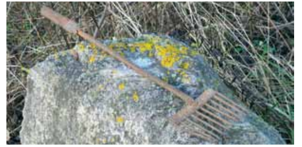
Браканьерскае прыстасаванне для лову ласосяў

Вы можаце прыняць удзел у патруляванні рэк. У межах праекта будуць арганізаваны інфармацыйныя сустрэчы з жыхарамі рэгіёна