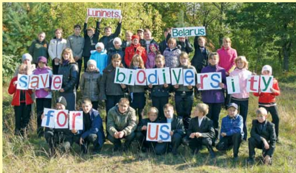
Дні назіранняў-2010. Зберагіце біразнастайнасць для нас (г.Лунінец)

Пляцоўка для назіранняў – гэта спецыяльна абсталяванае часовае месца, куды можа прыйсці любы ахвочы і