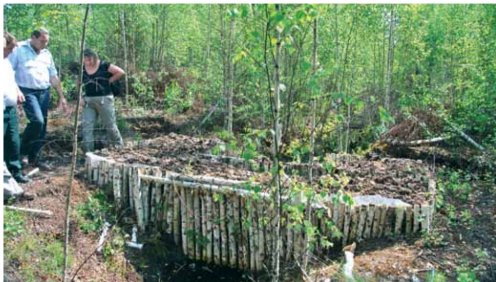
Плотина перекрывает картовый канал на Долбенишках.

Восстановление гидрологического режима нарушенного болота Долбенишки Шарковщинского района Витебской области было начато в 2010 г. и завершилось летом 2011 г. Площадь восстановленной территории – 5501 га. Восстановительные работы были сконцентрированы на участке бывшей торфоразработки. В соответствии со строительным проектом, было построено 30 земляных и комбинированных (земляных и деревянных) перемычек на картовых и магистральном каналах.