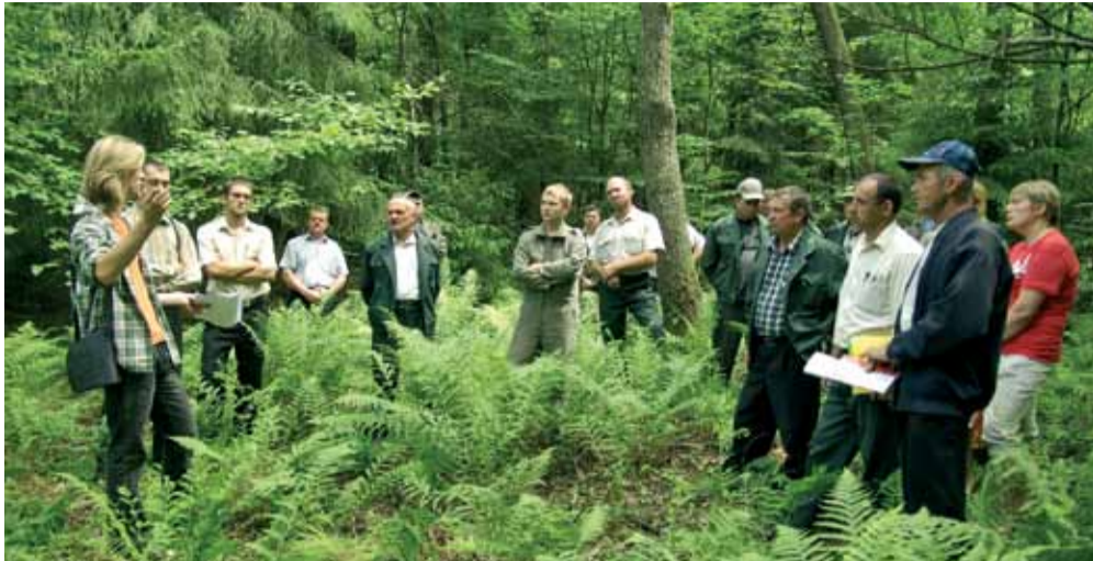
Палявы семінар у Івацэвіцкім раёне

Заклучным мерапрыемствам праекта «Акцыя для арлоў і людзей. Захаванне рэдкіх відаў Выганашчанскага рэгіёна сіламі грамадскасці», які адбыўся пры падтрымцы праграмы малых грантаў пасольства ЗША, сталі семінары-трэнінгі для работнікаў ДЛГУ «Целяханскі лягас» і «Ганцавіцкі лягас».