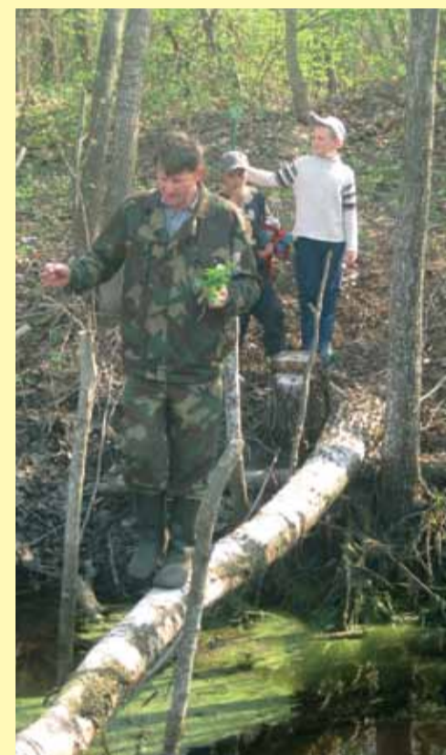
Местные жители обследуют территорию будущего заказника

Мы считаем, что нельзя учить биологии, географии и экологии по книжкам и в классных комнатах, детей надо выводить, вывозить и «вытаскивать» в дикую природу, где давать им возможность познакомиться с окружающими растениями и животными, исследовать водоёмы,