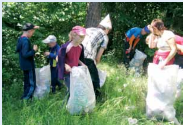
Быў вывезены цэлы трактарны прычэп смецця.

7 чэрвеня 2011 года на тэрыторыі помніка прыроды рэспубліканскага значэння «Старабарысаўскі лес» (Барысаўскі р-н Мінскай вобл.) прайшла акцыя «Марш паркаў», прысвечаная Міжнароднаму дню аховы навакольнага асяроддзя. Арганізатарамі акцыі выступілі ДУА «Барысаўскі экалагічны цэнтр дзяцей і юнацтва», Барысаўскае раённае аддзяленне АПБ, Барысаўская раённая інспекцыя прыродных рэсурсаў і аховы навакольнага асяроддзя, Прыгараднае лясніцтва Барысаўскага лясгаса.