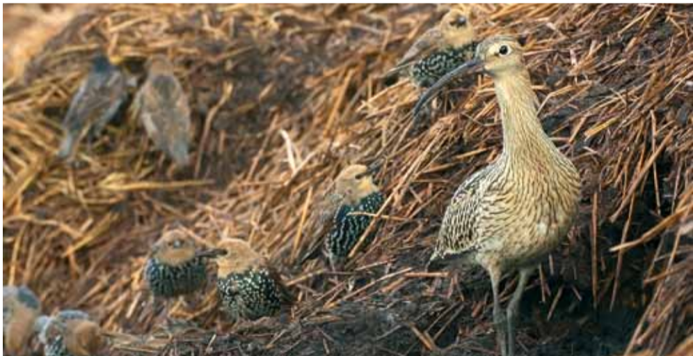
Большой кроншнеп и «маленькие» скворцы.

Национальный парк Браславские озера претендует на статус рамсарской территории – водно-болотных угодий международного значения. Кроме того, данная территория может официально стать и территорией, важной для птиц (ТВП).