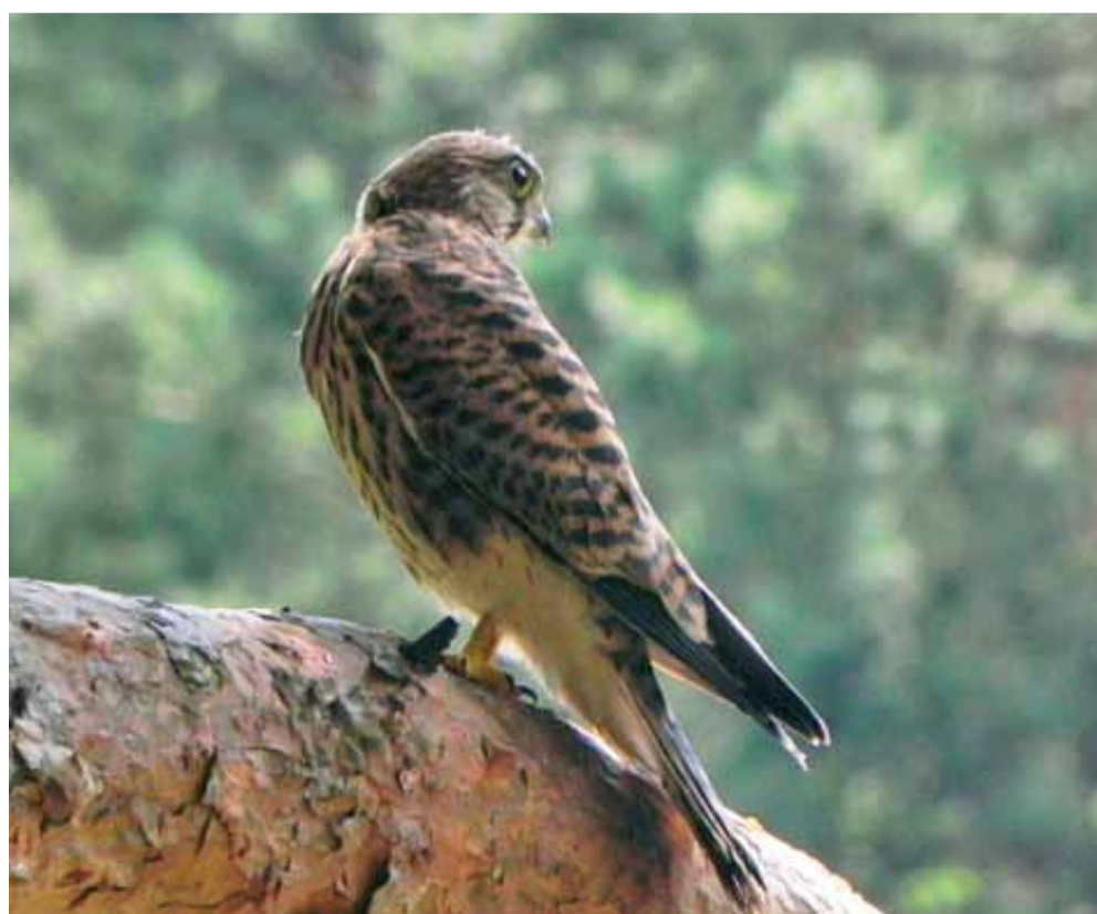
Пустельга - привычная обительница г.п. Мачулищи.