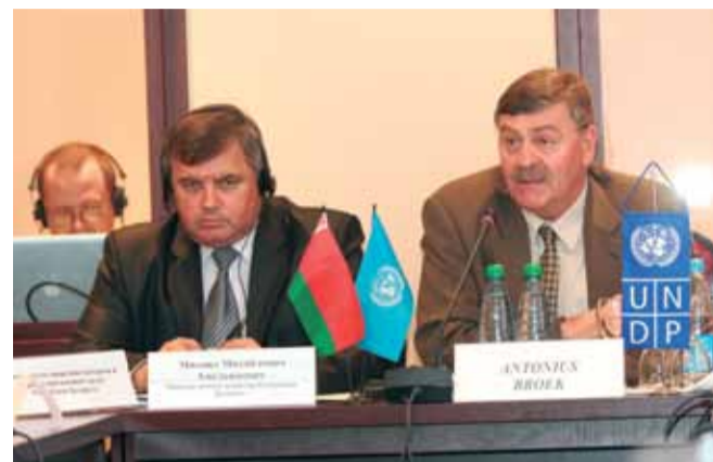
Министр лесного хозяйства РБ Михаил Амелянович и представитель ООН в РБ Антониус Брук

Открывая пресс-конференцию, Антониус Брук, представитель ООН/ПРООН в Беларуси, сообщил, что Программа развития ООН и Программа малых грантов Глобального экологического фонда инвестировали в восстановление нарушенных торфяников в Беларуси в общей сложности около 4 млн долларов, что позволило успешно реализовать ряд проектов по повторному заболачиванию нарушенных болот. В своем выступлении Представитель ООН/ПРООН в