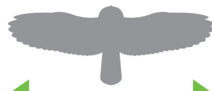
Размах крыльев – до 100 см