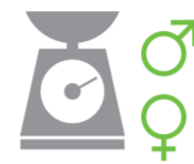
Самец – 220–280 г