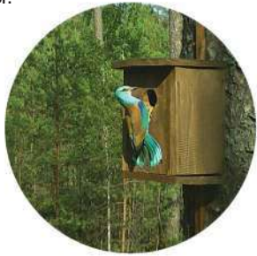
Здымак атрыманы з аўтаматычнай камеры, усталяванай пры падтрымцы Ruffed Small Grant

Сяброў АПБ і захавальнікаў ТВП чакае не менш насычаная восень. Сачыце за абвесткамі і далучайцеся да нашых мерапрыемстваў. Разам для прыроды і людзей!