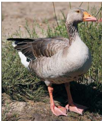
Шэрая гусь

Нацыянальная кампанія «Птушка года» праводзіцца з 2000 года грамадскай арганізацыяй «Ахова птушак Бацькаўшчыны» (АПБ), якая з'яўляецца нацыянальным партнёрам глабальнай прыродаахоўнай асацыяцыі BirdLife International у Беларусі. Асноўная мэта кампаніі – падтрыманне грамадскага меркавання аб каштоўнасці біразнастайнасці, неабходнасці захавання птушак як аднаго з яе ўнікальных кампанентаў і заахвочванне насельніцтва да актыўнай аховы птушак. Штогод АПБ выбірае від птушак, які мае пэўныя праблемы і патрабуе нашай увагі і дапамогі. У папярэднія гады птушкамі года былі белы бусел, белая пліска, авяльга, дамовы верабей, гарадская ластаўка, барадатая кугакаўка, кнігаўка, звычайны салавей, вялікая белая чапля. У рамках кампаніі звычайна праводзяцца разнастайныя конкурсы, акцыі і прыродаахоўныя мерапрыемствы. Птушкай 2009 года абвешчана шэрая гусь. Гэта рэдкі гняздуючы ў нашай краіне від. Шэрая гусь была занесена ў апошняе выданне Чырвонай кнігі РБ (2004). Затым, на жаль, яе вынеслі з Чырвонай кнігі, і шэрая гусь трапіла ў лік паляўнічых відаў. Асабліва адмоўна на гнездавой папуляцыі шэрых гусей сказваецца веснавое паляванне, якое ў значнай меры супадае з перыядам іх гнездавання.