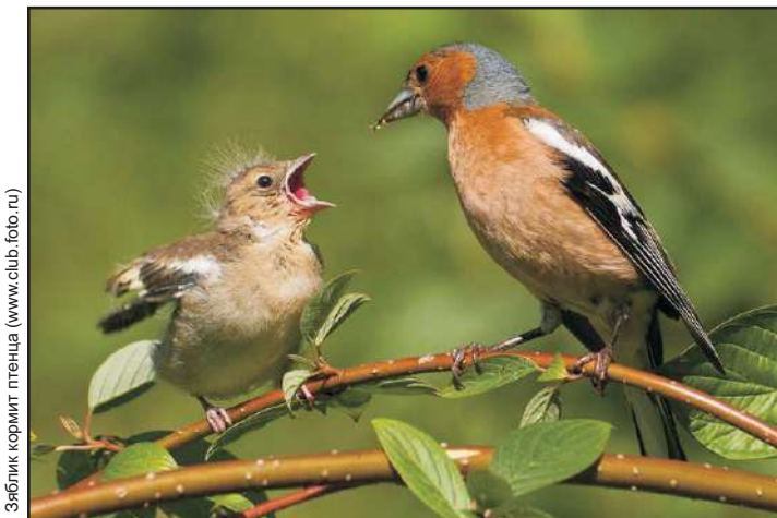
Зяблик кормит птенца

Что же произошло на самом деле? Почему птенца оставили родители? У воробьиных птиц птенцы оставляют гнездо часто еще не имея двух недель от роду: еще не умея летать, или будучи способными к перелету на небольшие расстояния. Проголодавшись, птенцы начинают пищать. По голосу родители, как правило, без труда находят птенцов, даже если те разлетелись на приличное расстояние. Но если вы не видите волнующихся взрослых птиц, это не значит, что птенец брошен. Родители в этот момент заняты добычей корма или кормлением других птенцов.