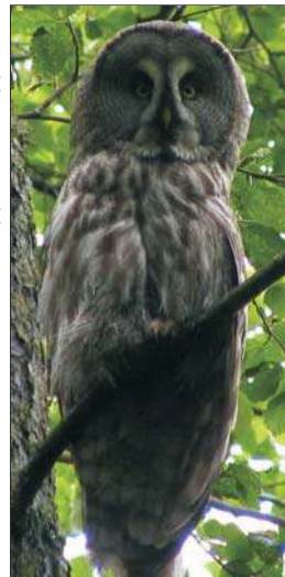
Барадатая кугакаўка.

Напэўна ў гэтым годзе летнік атрымаўся адным з самых удалых за апошнія 5 год. Удалося і птушак пабачыць-пачуць, і гнездавыя скрыні праверыць, і новыя развесіць, а таксама проста адпачыць у кампаніі старых і новых сябраў. Разам для птушак і людзей!