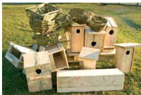
Вынікі семінара-трэнінга – 20 штучных гнёзд.

Самым цікавым мерапрыемствам, безумоўна, стаў семінар-трэнінг па лозапляценню і вырабу штучных гнездавых скрынь для драпежных птушак. Пры дапамозе запрошанага майстра прысутныя змаглі засвоіць метадыку пляцення з лазы і паспрабаваць зрабіць штучнае гняздо ў выглядзе