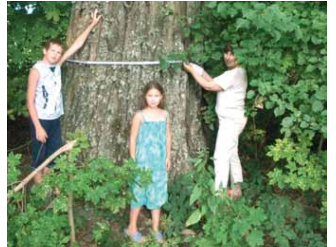
Школьнікі мераюць шырыню дрэва.

Шумілінскае аддзяленне АПБ рэалізавала праект “Інвентарызацыя векавых і ўнікальных дрэў на тэрыторыі раёна”. У рэалізацыі праекта прынялі ўдзел школы Шумілінскага раёна. Асабліва актыўнымі і прадуктыўнымі былі: Шумілінская раённая гімназія, Мішкаўская СШ, Мішневіцкая СШ, Башнёўская СШ, Крывасельская д/с-СШ Гарадоцкага раёна.