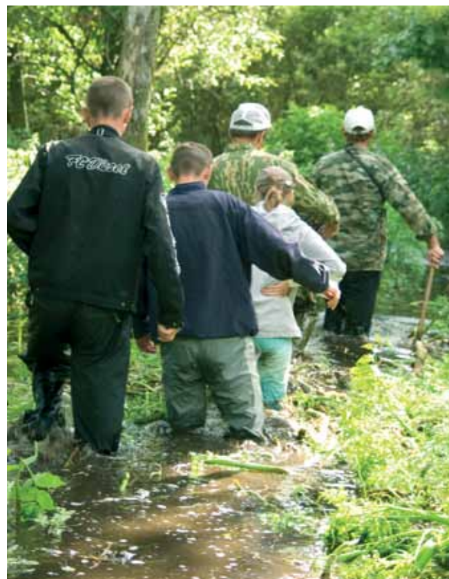
Цяжкі шлях да калоніі чапель і бакланаў

За гэты час у рамках праекта ў супрацоўніцтве з дырэкцыяй заказніка “Сярэдняй Прыпяць” выраблены і развешаны гнездавыя скрыні для белай сініцы і сіваграка, праведзены ўлікі вяртлявай чаратоўкі і драча, зроблены ўлікі белага бусла ў вёсках, прылягаючых да заказніка, арганізаваны экскурсіі па Прыпяці для дарослых і школьнікаў.