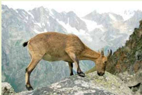
Каўказскі тур.

10 сакавіка – Падарожжа ў краіну вікінгаў. Яўген Сліж.