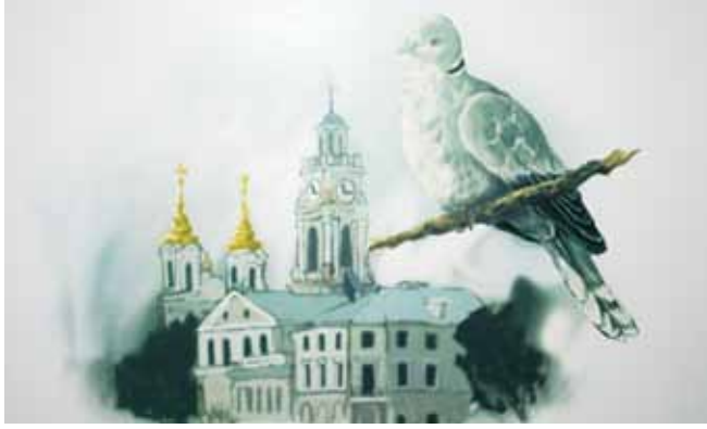
Малюнак Антона Шчэрбіка, супрацоўніка Віцебскага дзяржаўнага ўніверсітэта, сябра АПБ

15 сакавіка 2010 г. Віцебскім гарадскім аддзяленнем АПБ у межах рэалізацыі міні-праекта “Птушка – сімвал Віцебска” быў аб’яўлены аднайменны конкурс, і 15 лістапада завяршыўся прыём матэрыялаў ад яго ўдзельнікаў. На конкурс паступілі пераважна малюнкi вучняў школ горада і студэнтаў Віцебскага дзяржаўнага ўніверсітэта. Па выніках аналізу малюнкаў і апытанняў, арніталагічным сімвалам Віцебска прызнана кольчатая туркаўка ( Streptopelia decaocto , кольчатая горлица, горлінка (устар.)).