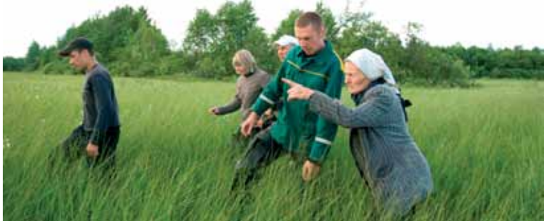
Захавальнікі ўлічваюць вяртлявую чаротаўку

Стартавалі ўлікі-2010 на ТВП “Балота Званец” у траўні. Як звычайна, улікі прайшлі з міжнародным рэзанансам: акрамя нашых, у іх прынялі ўдзел і замежныя госці – з Польшчы, Германіі, Нідэрландаў.