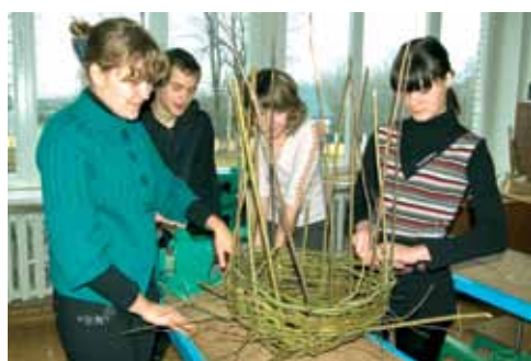
Галінка за галінкай – і новая “кватэра” для барадаты кугакаўкі будзе гатова.

каша для розных відаў соў. У плеченых кашах змогуць гнездавацца барадаты кугакаўкі і вушастыя совы, якія не ўмеюць самі рабіць гнёзды. Незвычайныя з выгляду “кватэры” лёгка падняць на дрэва, а дзякуючы пляценцы, яны падобныя на сапраўдныя гнёзды. Таксама ў іх не будзе застоўвацца вада.