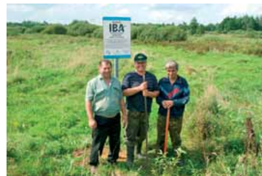
Супрацоўнікі Валакацкага лясніцтва пасля усталявання стэнду

Стэнд пра ТВП “Налібоцкая пушча” быў усталяваны супрацоўнікамі РУП “Белдзяржпаляванне” на ўездзе ў лясны