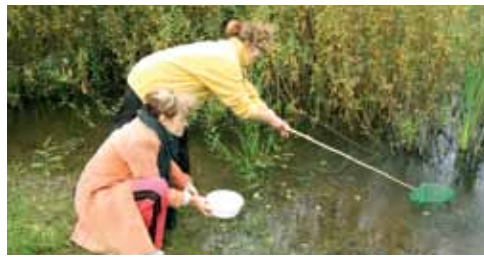
Настаўнікі вывучаюць біязнастайнасць вадаёма.

Асаблівую ўвагу хацелася б звярнуць на блок практычных трэнінгаў, якія адбыліся на базе ДПУ “Бярэзінскі біясферны запаведнік” увосень 2010 г. У трэнінгах прыняло ўдзел