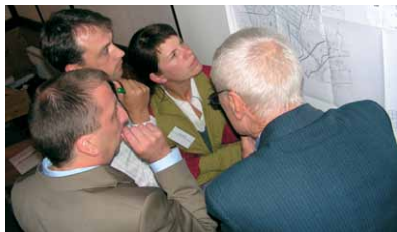
Обсуждение проекта повторного заболачивания болота «Островское»

С 9 по 11 сентября 2010 г. близ болота «Островское» в Миорском районе Витебской области прошел научно-практический семинар «Гидрологические принципы и подходы к планированию восстановления верховых болот». Это первый из двух семинаров, посвященных восстановлению нарушенных торфяников, проводимый АПБ в рамках проекта.