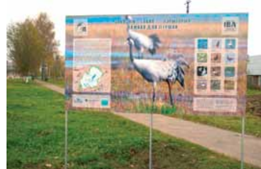
Інфармацыйны стэнд “Ельня” у г. Міёры

масіў, які знаходзіцца на 87 км трасы Гродна–Мінск. Цяпер малы падорлік будзе сустракаць кожнага госця Налібоцкай пушчы.