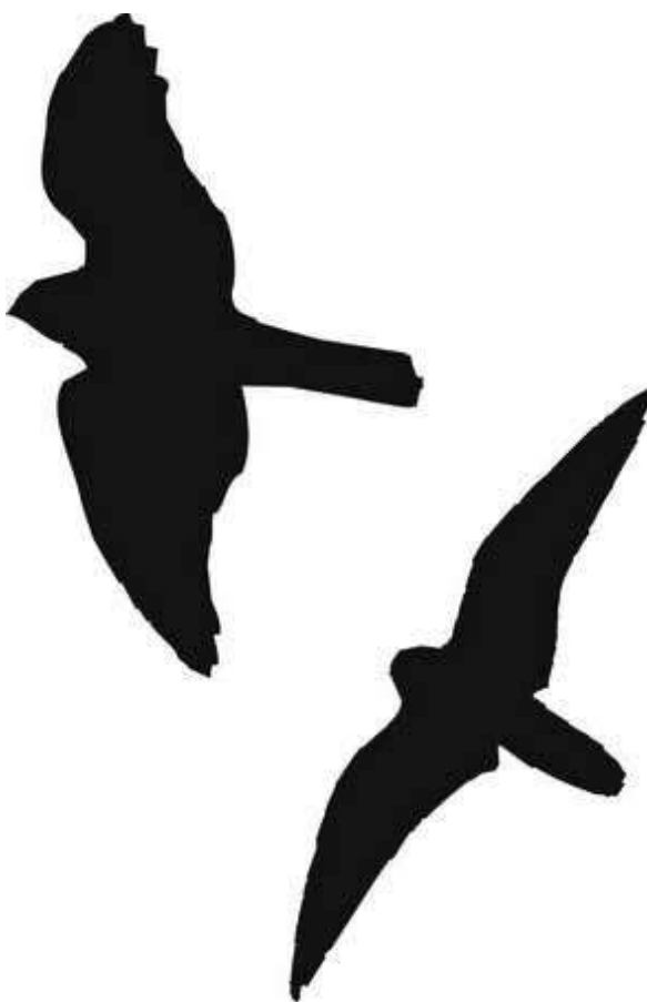
Варианты силуэтов хищных птиц, которые наклеиваются на стеклянные поверхности экранов