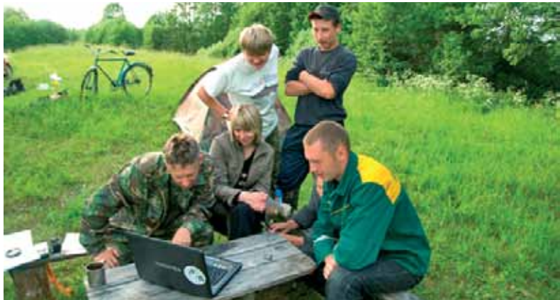
Палявы семінар перад улікамі

Балотныя сцяжынкі, спяванне і крык птушак, людзі, бескрыбетная драбязя, што лезе ў вочы і вушы – усё ўспамінаецца, добрае ці не вельмі. Радуе, што ў гэтым годзе пасільны ўдзел ва ўліках узялі і захавальнікі некалькіх тэрыторый.