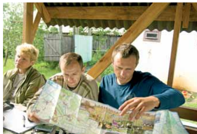
Знаёмства з маршрутам

14 лістапада ў Лунінцы прайшла сустрэча, арганізаваная для захавальнікаў ТВП “Сярэдняй Прыпяць”. Яе мэта – падвядзенне вынікаў працы па праекце за вяснова-летні сезон 2010 года.