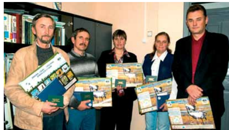
Уручэнне пасведчанняў грамадскага інспектара у Міёрскай раённай інспекцыі прыродных рэсурсаў і аховы навакольнага асяроддзя

Напрыклад, грамадскія інспектары могуць прымаць уд-