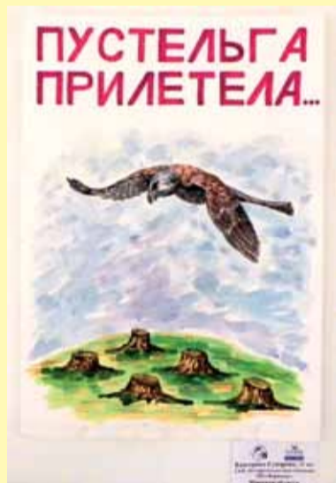
Плакаты К. Суворавы