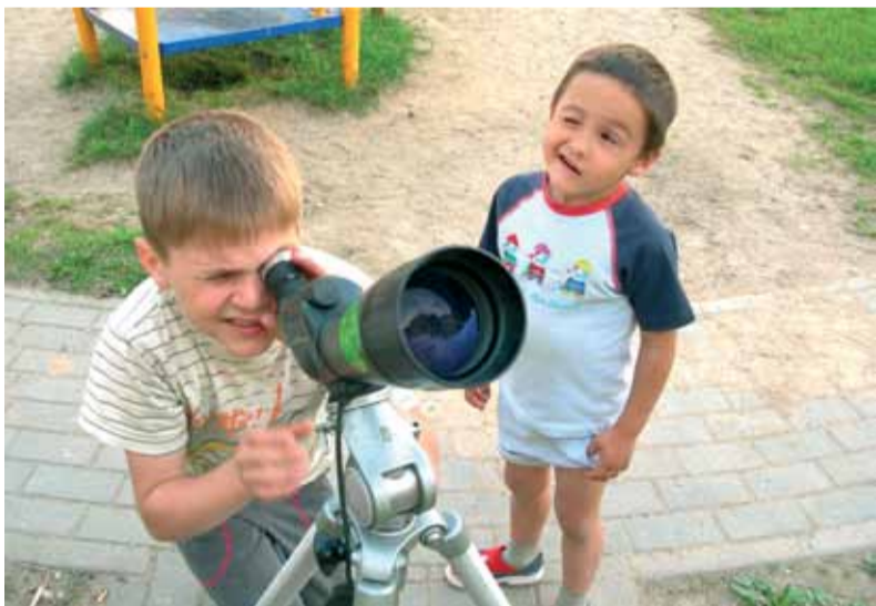
«Трэнёўка вока» - першае месца ў катэгорыі «Людзі». Аўтар Дз. Вінчэўскі

Запрашаем усіх жадаючых прыняць удзел у штогадовым фотаконкурсе АПБ «Птушкі ў аб'ектыве». Пачынаючы з 2010 года, конкурс праходзіць у два этапы. Першы этап – этап адбору здымкаў-фіналістаў – будзе адбывацца ў галерэі на сайце www.birdwatch.by . Для таго, каб размясціць свае здымкі ў галерэі, аўтарам неабходна зарэгістравацца на сайце. Удзельнічаць у галасаванні могуць таксама толькі зарэгістраваныя карыстальнікі сайта. На працягу кожных двух тыдняў абіраюцца найлепшыя 5 фотаздымкаў у двух катэгорыях: «Птушкі» і «Людзі» (маюцца на ўвазе людзі, якія назіраюць/вывучаюць/фатаграфуюць птушак). На кожны двухтыднёвы конкурс адзін аўтар можа выставіць не больш за 5 сваіх здымкаў у кожнай з катэгорый. Калі здымкаў падаецца больш, трэба ў іх апісанні пазначыць, якія работы выстаўляюцца па-за конкурсам.