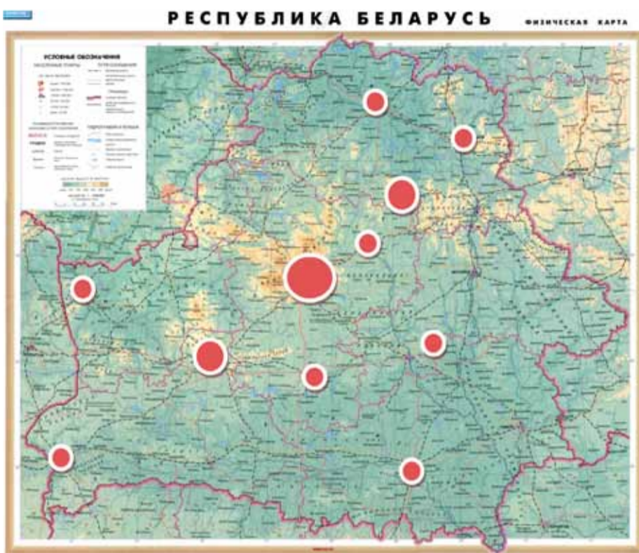
Распределение основных мест зимовки

Как и в прошлые годы, основным местом зимовки водоплавающих птиц является