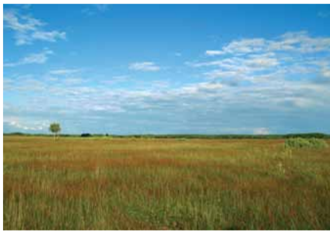
Болото Дикое.

АПБ приглашает вас принять участие в учетах численности вертлявой камышевки. Полевые лагеря по проведению учетов пройдут с конца мая по начало июля 2011 года в Брестской области Беларуси.