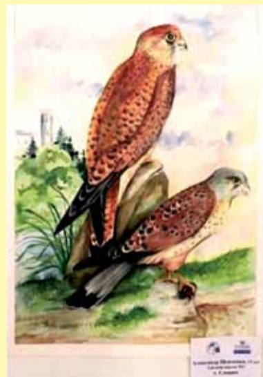
Малюнак А. Шаўчэнка