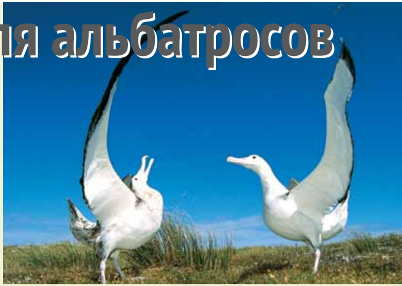
Величественные альбатросы.

Десятки тысяч альбатросов умирают ежегодно по вине рыбаков, а вернее приспособлений, которые используются для промышленного лова рыбы. Это длинные линии крючков с наживкой, которая привлекает птиц, а потом утаскивает их на дно. Один корабль может иметь подобную линию, растянутую на 130 км и содержащую от 10 000 до 20 000 крючков. Около 100 000 альбатросов ежегодно погибает после обеда такой наживкой.