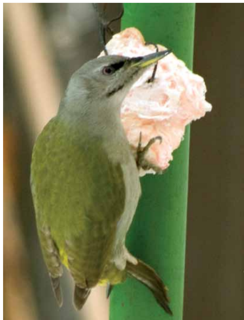
Редкий гость на кормушке – седой дятел.

Подведены итоги зимних учетов птиц-2011. Количество участий в наблюдениях за птицами составило 1 459