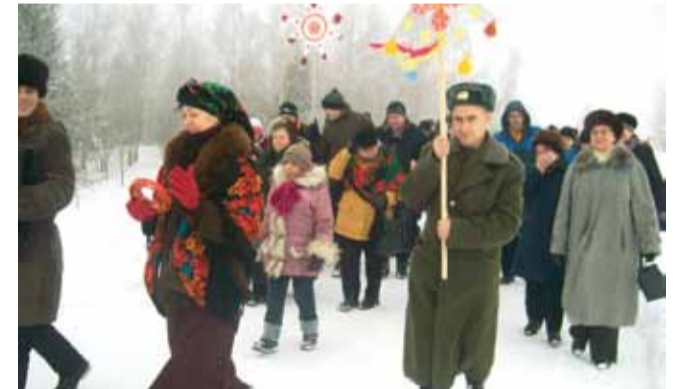
Абрад "Каляда".

Беларускі музей народнай архітэктуры і побыту ў в. Строчыцы Мінскага раёна, як заўсёды, гасцінна распахнуў свае дзверы для ўдзельнікаў праекта АПБ "Птушкі ўсім узростам даспадобы".