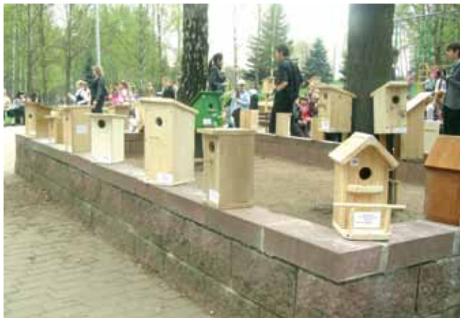
Выстава домікаў для птушак

У гэтым годзе Тыдзень Птушак у Мінску прайшоў як ніколі актыўна. Адным з самых цікавых мерапрыемстваў кампаніі стаў адкрыты экалагічны конкурс для ўстаноў адукацыі г. Мінска “Хатка для крылатага сябра”. На конкурс паступіла каля 100 прац. Самымі актыўнымі аказаліся навучэнцы 19-й гімназіі, якія прадставілі на конкурс 26 хатак: сінічнікаў, хатак для сітавак і рудах-востак. У конкурсе прынялі таксама ўдзел і вучні з Міёр, Оршы і іншых гарадоў Беларусі.