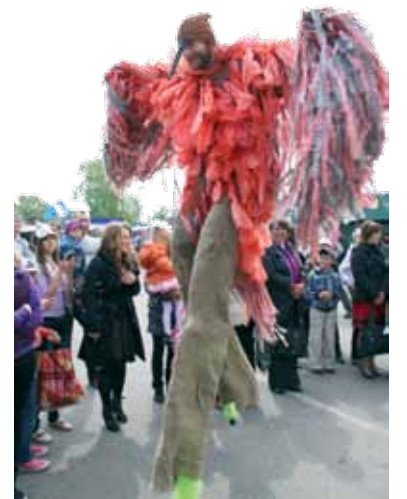
У натоўпе паважна шпацыраваў велізарны турухтан на хадулях, выклікаючы захапленне не толькі ў мясцовых дзятвей, але і ў стальных жыхароў

Фэст кулікоў традыцыйна адрознівае адукацыйны аспект. У гэтым годзе ўсе жадаючыя змаглі паўдзельнічаць у творчых майстар-класах. Пад