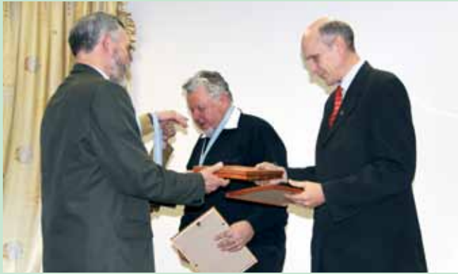
Каманда-пераможца леташняга чэмпіянату атрымлівае ўзнагароду на З'ездзе АПБ.

Запрашаем прыняць удзел у VIII чэмпіянаце па спартыўнай арніталогіі. Ён традыцыйна адбудзецца ў першую суботу восені (3 верасня). Але на гэты раз удзельнікі будуць назіраць за птушкамі не 9 гадзін, як раней, а 12 (з 6.00 да 18.00).