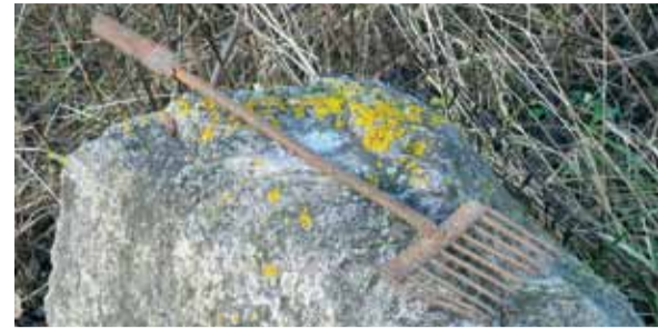
Браканьерскае прыстасаванне для лову ласосяў

Вы можаце прыняць удзел у патруляванні рэк. У межах праекта будуць арганізаваны інфармацыйныя сустрэчы з жыхарамі рэгіёна