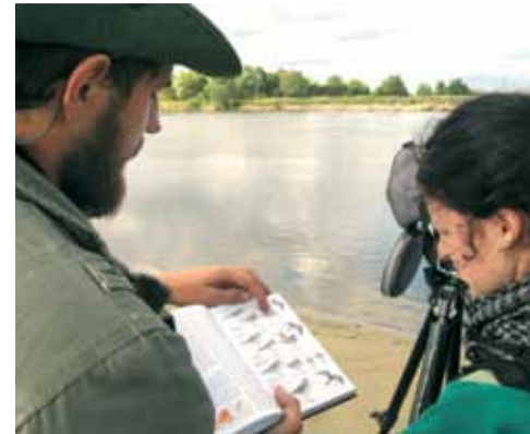
Праца з вызначальнікам – важны элемент у навучанні правільна вызначаць від.

Такі летнік я праводзіў упершыню, таму ён быў карысны не толькі для студэнтаў, якія прыехалі ў Тураў, але і для мяне асабіста, падцвярджаючы тым самым прынцып: навучаючы, вучышся