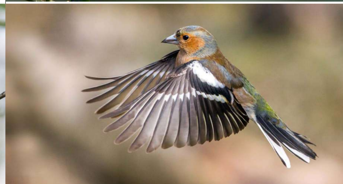
Берасцянка - сваякі шчыгела